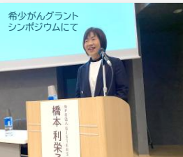
希少がんグラントシンポジウムにて

8/25のキャンサーフォーラム、11/30の希少がんグラントシンポジウムではブースを出展し啓発活動を行いました。2023年12月に愛知県がんセンターのDCT(オンライン治験)セミナー、2024年10月に成果報告会に登壇。また12月には国立がん研究センター患者・家族との意見交換会に参加しています。